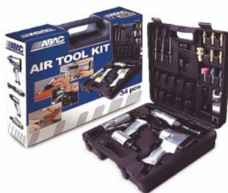
HERRAMIENTAS NEUMÁTICAS Y ACCESORIOS VARIOS