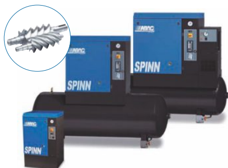
COMPRESORES DE TORNILLO