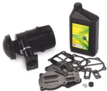
KITS DE REPARACION