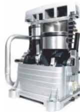
Sistema de compresión de Doble Etapa a partir de 3kW