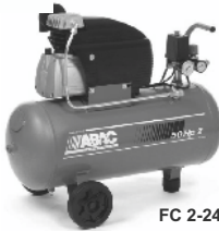
FC 2-24 CM